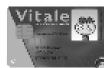
la carte vitale